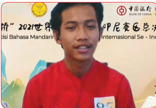
Juara dua SMA non etnis Tionghoa.