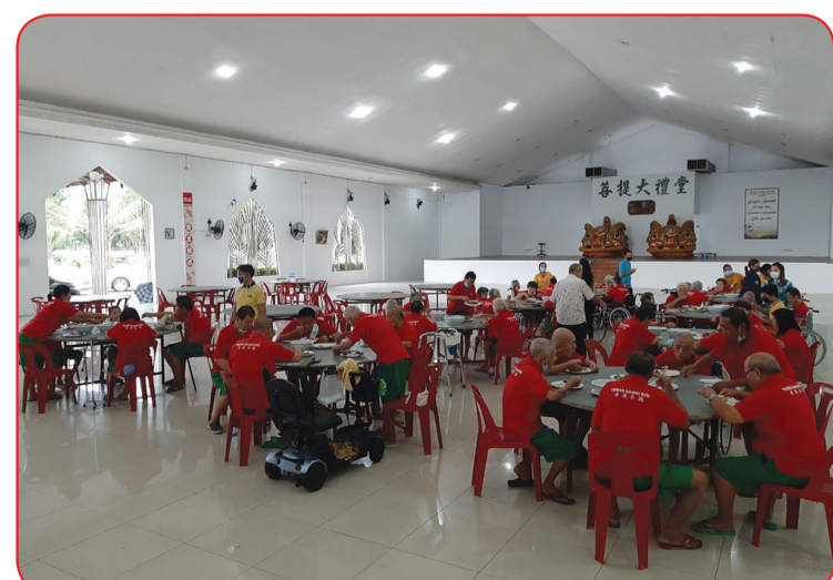
Para lansia menikmati hidangan jamuan.