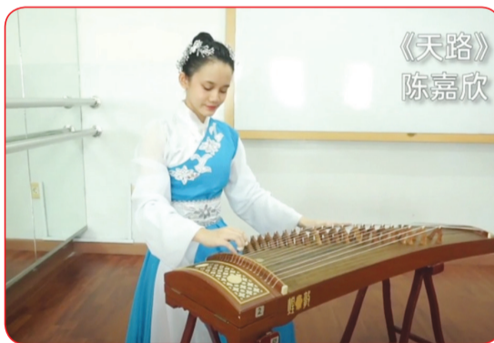
Juara dua SMA etnis Tionghoa.