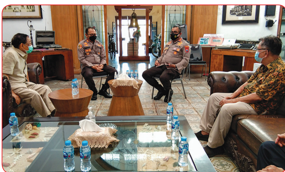
Jajaran Maspion Group beramah tamah dengan pejabat Polrestabes Surabaya usai serah terima bantuan.