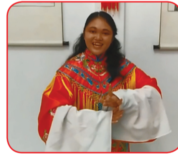
Juara tiga etnis Tionghoa.