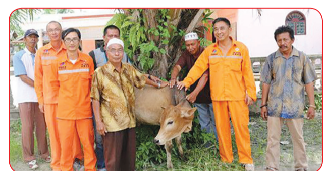
Serikat Pekerja Proyek PLTU Pangkalan Susu menyerahkan satu ekor sapi kepada penduduk setempat pada Hari Raya Idul Adha 11 September 2016.

dan menghasilkan listrik, PLTU ini telah memberikan kontribusi 16,75% dari beban daya puncak ke Sumatera Utara Indonesia.