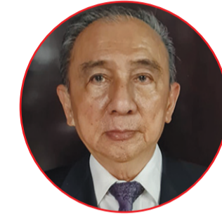
Tian Jin Tang

JAKARTA (IM) - Center for Language Education and Cooperation dan Kedubes Tiongkok untuk Indonesia bersama dengan BKPBM Jakarta, PBM Universitas Al Azhar, 18-20 Juni lalu menggelar kompetisi profisiensi "Chinese Bridge" babak final kawasan Indonesia Siswa SMU ke-14 dan Mahasiswa Universitas ke-20.