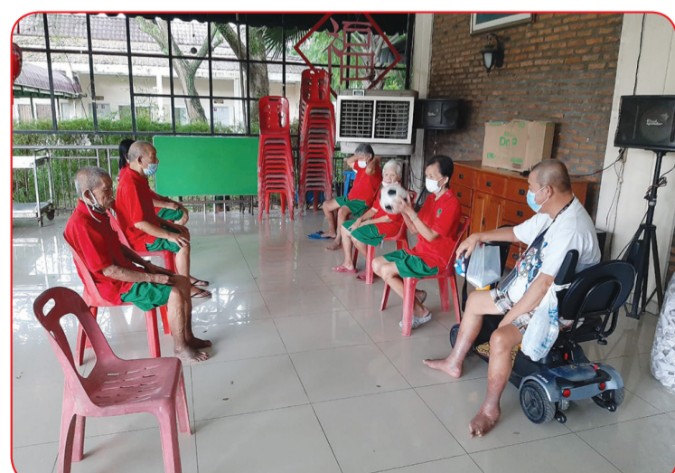
Para lansia berolahraga lempar bola di sore hari.