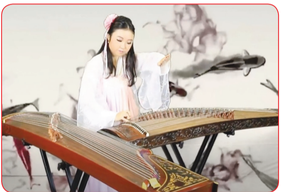
Juara pertama SMA.