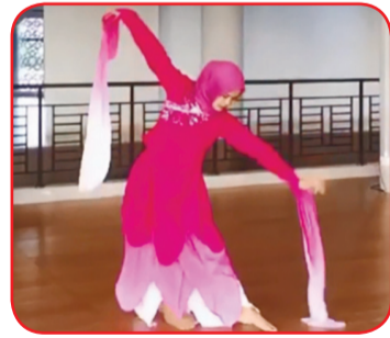
Juara dua non etnis Tionghoa.