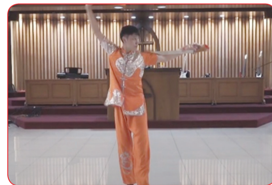
Juara tiga SMA etnis Tionghoa.