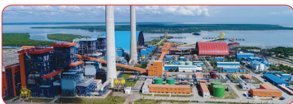
Panorama PLTU Pangkalan Susu.