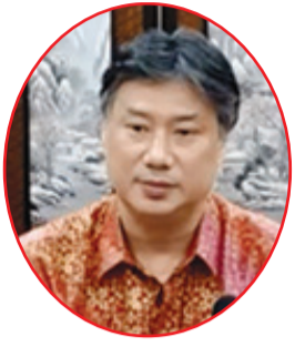
Atase Zhou Bin