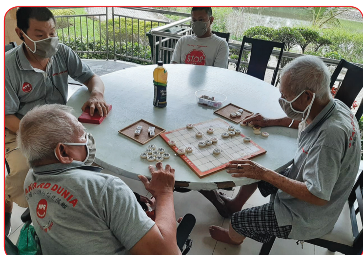
Para lansia bermain xiangqi di waktu luang.