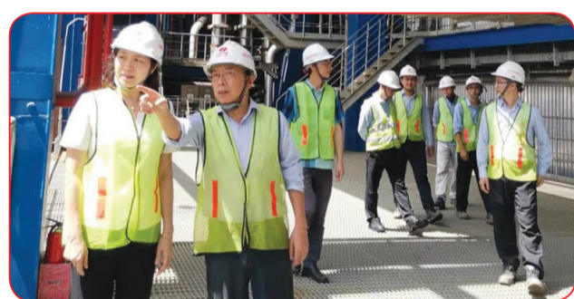
TINJAU PROYEK: Konjen Tiongkok di Medan Qiu Weiwei pernah meninjau proyek PLTU Pangkalan Susu 26 November 2019.

Selama pengerjaan proyek, telah dibuat sejumlah