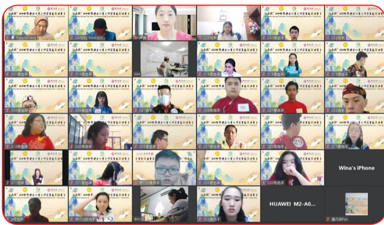
Para peserta lomba kategori SMA.

Hal ini sangat sesuai dengan kesadaran masyarakat dari semua kelompok etnis di dunia untuk bertoleransi dan saling belajar satu sama lain serta membangun komunitas bersama masa depan umat manusia era baru. Khususnya memiliki konsep yang lebih mendalam pada zamannya