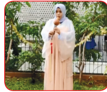
Juara tiga non etnis Tionghoa.