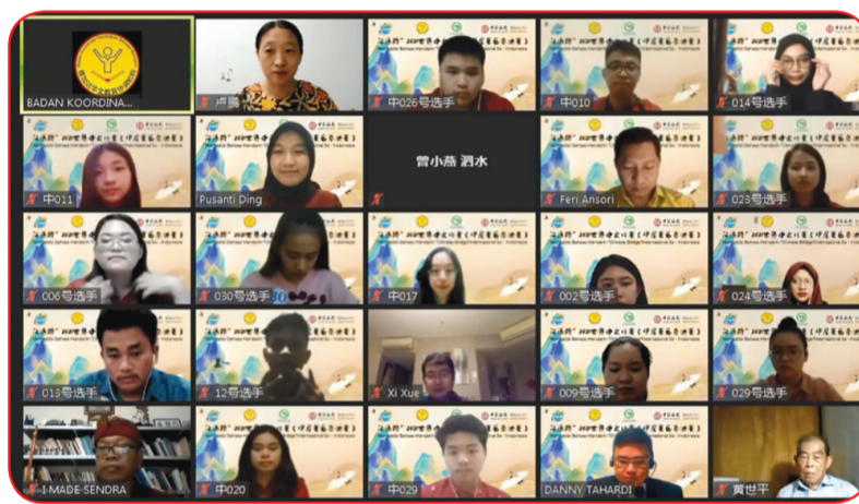
Para peserta lomba kategori Universitas.

dengan berlatar belakang pandemic Covid-19.