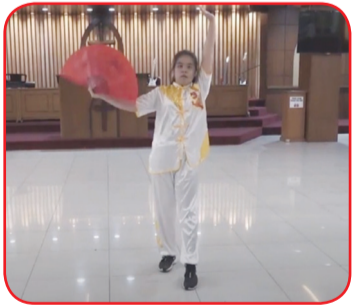
Juara tiga SMA non etnis Tionghoa.