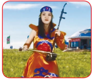
Juara pertama Universitas.